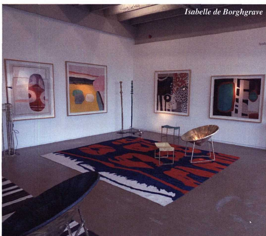
Isabelle de Borghgrave